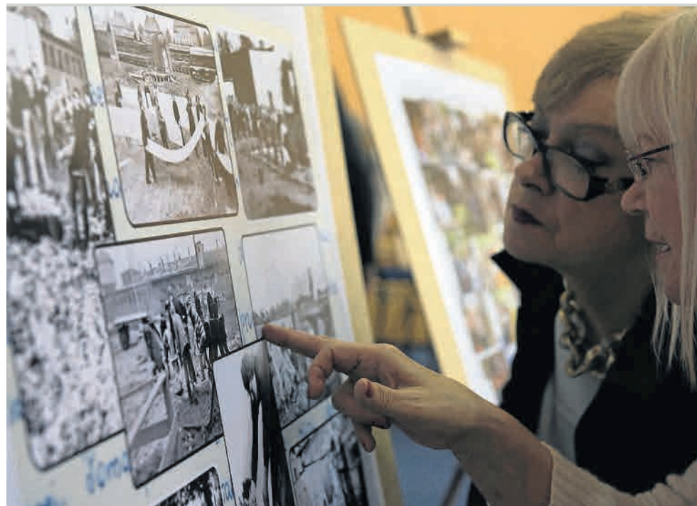
▶ W czasie jubileuszu był czas na spotkania dawnych znajomych i wspomnienia szkolnych lat

W piątek szkołę odwiedzili m.in. absolwenci, którzy maturę pisali w 1962 roku