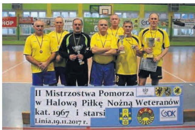
► Słupscy piłkarze weterani nadal nadają ton rozgrywkom w tej kategorii na arenach Pomorza

Zatem do rywalizacji przystąpiło 6 ekip piłkarskich, któ-