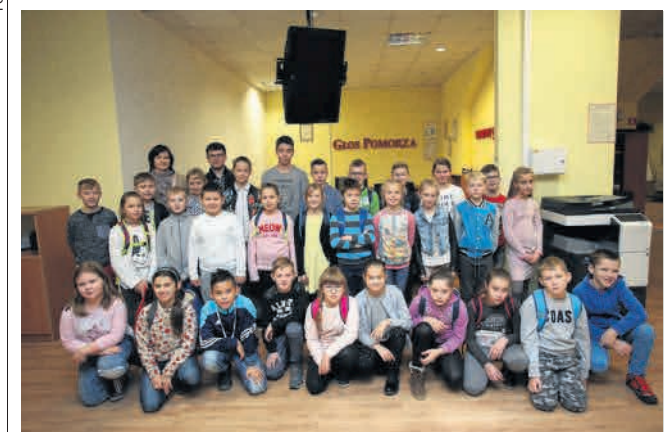
▶ Uczniowie dwóch klas czwartych ze Szkoły Podstawowej w Potęgowie odwiedzili Słupsk, w tym naszą redakcję

Znajdą się w nim również inne atrakcje, które dzieci zobaczyły w mieście, uczestnicząc w lekcji w Miejskiej Bibliotece publicznej i bawiąc się w grę wielkoformatową w Muzeum Pomorza Środkowego. ● ©