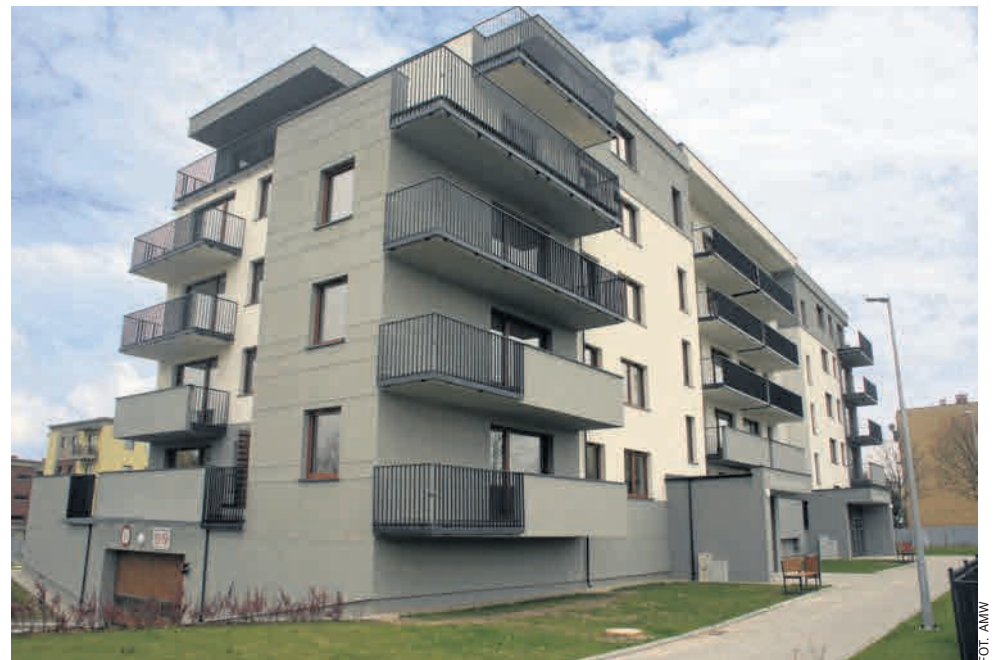
► W pełni wykończony blok dla wojskowych przy ul. Kosynierów Gdyńskich 3 w Słupsku czeka już na zasiedlenie przez lokatorów

- Żołnierze we własnym zakresie będą musieli zadbać jedynie o meble i inne wyposażenie mieszkania - dodaje Wyszynska.