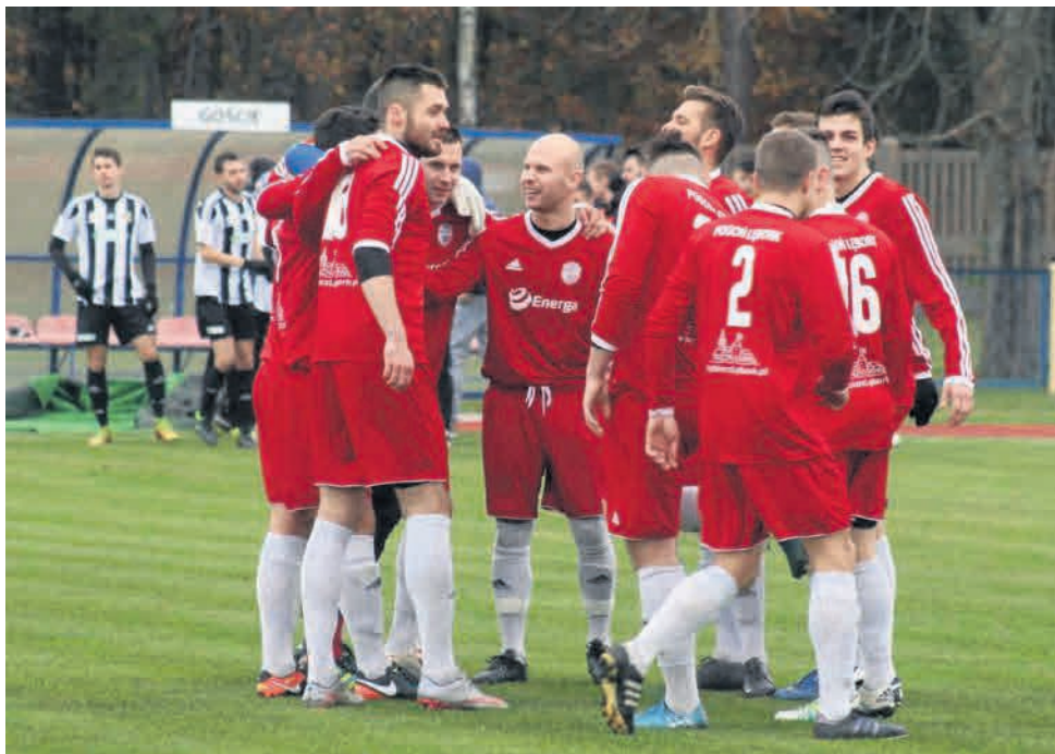
► Możliwe jest rozegranie dzisiejszego spotkania na murawie sztucznej

Zbliżające się pogorszenie pogody wymusiło działania umożliwiające rozegranie jutrzejszego meczu z Sokółem