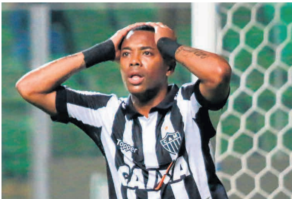
► Robinho wraz z pięcioma kolegami z Brazylii mieli zgwałcić obywatelkę Albanii, którą wcześniej upili w mediolańskim klubie. 33-letni piłkarz nie przyznaje się do winy i zapowiada złożenie apelacji

Pewne jest jedno, ulubieńcem kibiców 99-krotny reprezentant Brazylii już nie zostanie. Piłkarze skazani za przestępstwa seksualne na trybunach, podobnie jak za kradkami, nie cieszą się dużą po-