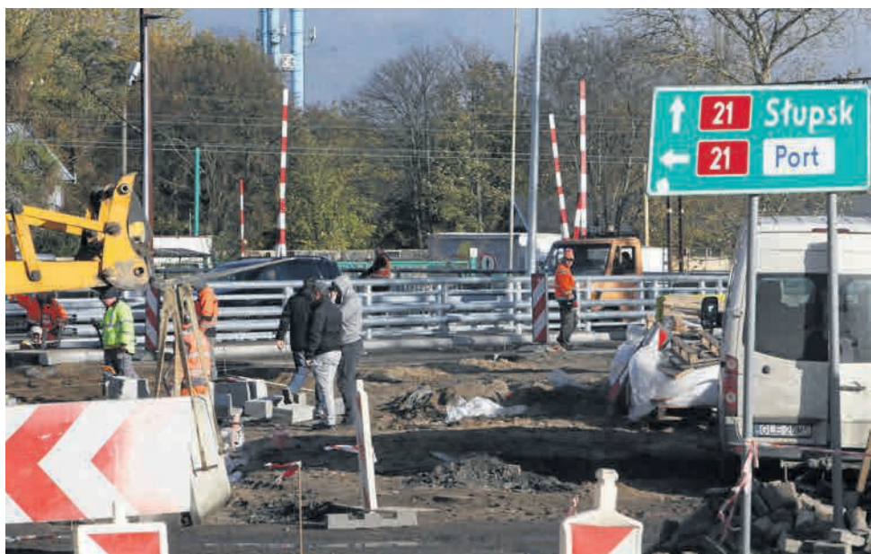
▶ Taki widok na szczęście należy już do przeszłości. Teraz budowlancy wykonują prace wykończeniowe. Inwestor zastanawia się, czy usprawiedliwić wykonawcy kilka miesięcy opóźnienia

Generalna Dyrekcja Dróg Krajowych i Autostrad, która zarządza drogą krajową nr 21, prawie zakończyła inwestycję w Ustce. - Obecnie główne prace na drogach i mostach przez Słupię w Ustce zakończyły się. Pracownicy wykonawcy prowadzą prace wykończeniowe i po-