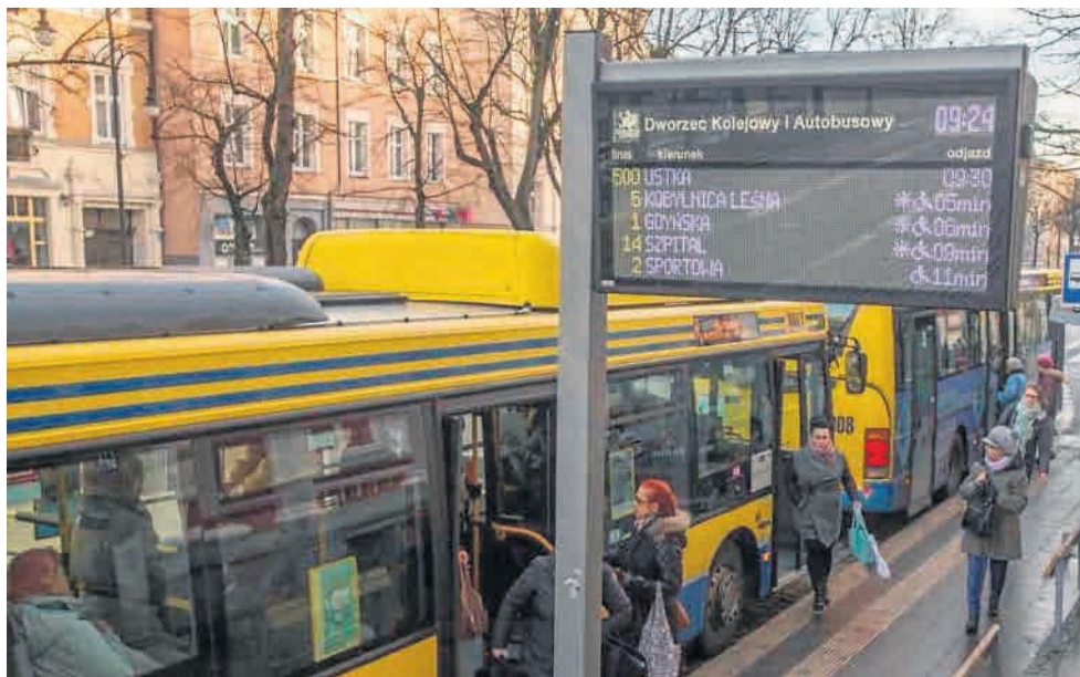
▶ Godziny odjazdów autobusów linii nr 500 w kierunku Ustki można zobaczyć na tablicy na przystanku przy ul. Wojska Polskiego oraz na tej zamontowanej przed wyjściem z dworca PKP